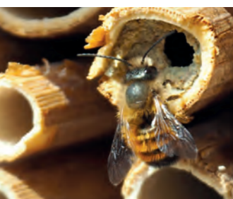
Bald werden die ersten Bewohner einziehen (hier: Rote Mauerbiene) und können dann gut beobachtet werden.

Einfach vorbeikommen & mitbauen – jede helfende Hand ist sehr willkommen!