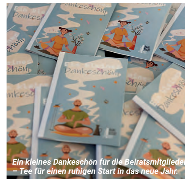
Ein kleines Dankeschön für die Beiratsmitglieder – Tee für einen ruhigen Start in das neue Jahr.

Mehr Informationen sowie den Antragsvordruck erhalten Sie im Stadtteilbüro oder unter www.rahlstedt-ost.de