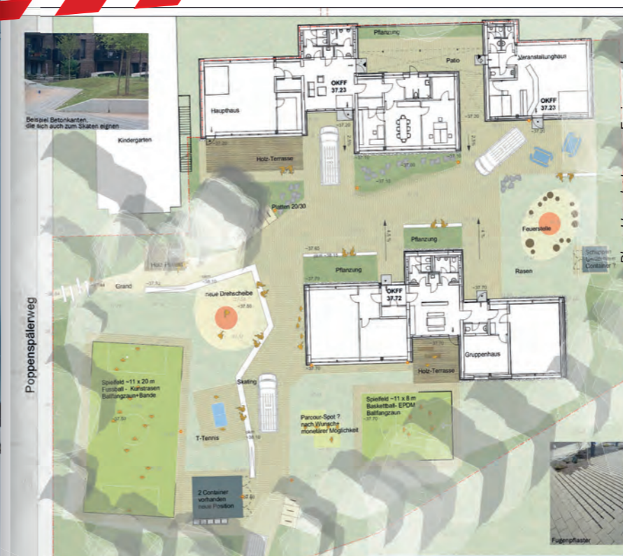
Plan: Hunck+Lorenz Freiraumplanung