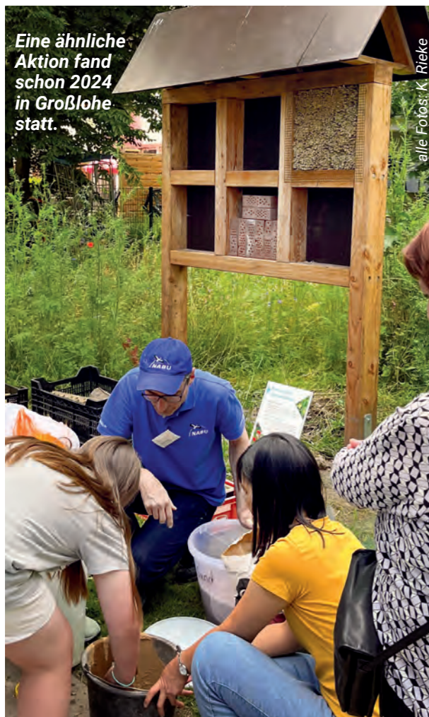
Eine ähnliche Aktion fand schon 2024 in Großlohe statt.

Die naturnahe SAGA-Geschäftsstelle Rahlstedt lädt in diesem Sommer gemeinsam mit dem NABU Hamburg (Naturschutzbund Deutschland e.V.) und ProQuartier zu einer ganz besonderen Bau- & Bastelaktion ein – und fördert damit den „Tourismus“ im Quartier auf ihre ganz eigene Weise: Es geht um summende, krabbelnde und so nützliche Gäste bei uns!