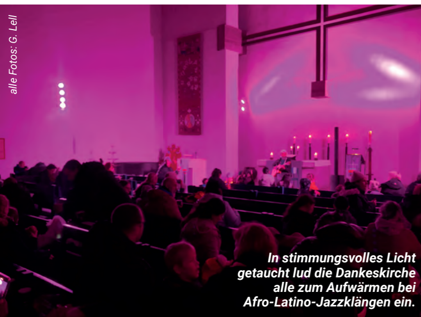
In stimmungsvolles Licht getaucht lud die Dankeskirche alle zum Aufwärmen bei Afro-Latino-Jazzklängen ein.

Gefördert wurde die Veranstaltung aus Mitteln des Verfügungsfonds Rahlstedt-Ost im Rahmen der RISE-Stadtteilentwicklung .