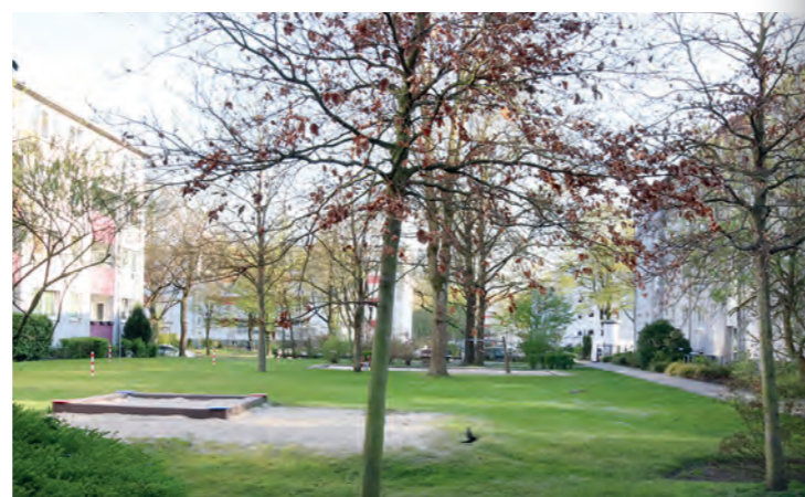
Der Mehrgenerationenhof südlich des Deichgrafenhaus, der auch im kommenden Jahr umgestaltet wird. Viel Grund zur Vorfreude: Die Planer haben tolle Entwürfe aus den Ideen der Bewohner gemacht!

Auch in den übrigen Bereichen möchten wir die Umgestaltung des Wohnumfelds und auch die Einrichtung der Mietergärten vorantreiben. Leider treffen uns die diversen Krisen in der Baubranche erheblich. Hatten wir bis vor Kurzem noch zahlreiche Verzögerungen im Bau wegen der Pandemie, trifft uns nun die Ukraine-Krise, die bei zahlreichen Baumaterialien für Engpässe sorgt. Gleichzeitig leiden sowohl Baufirmen als auch Planungs- und