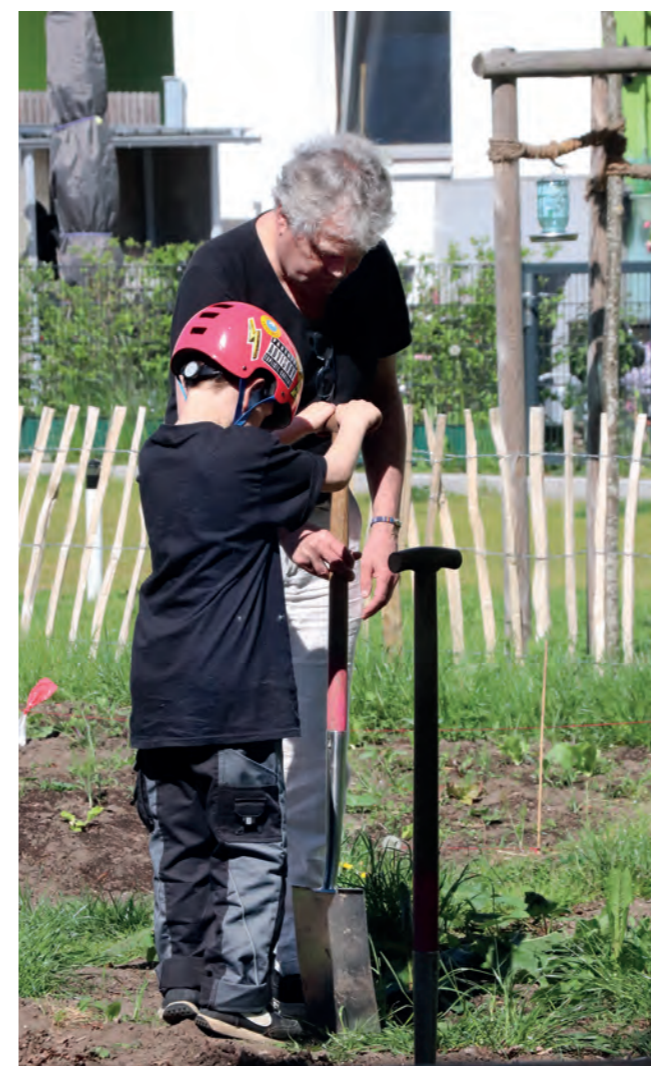
Buddeln vereint Jung und Alt!