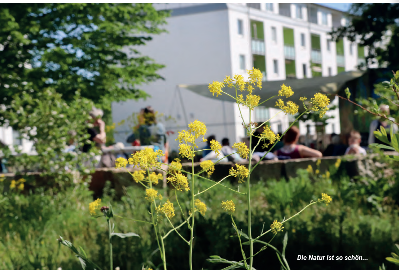
Die Natur ist so schön...