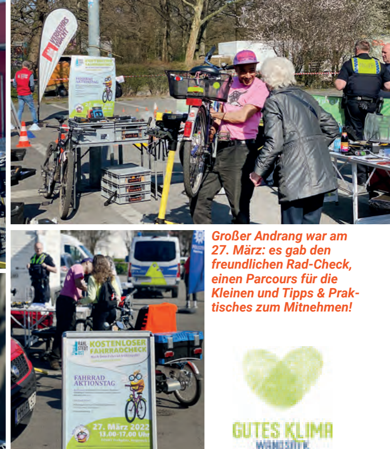
Großer Andrang war am 27. März: es gab den freundlichen Rad-Check, einen Parcours für die Kleinen und Tipps & Praktisches zum Mitnehmen!