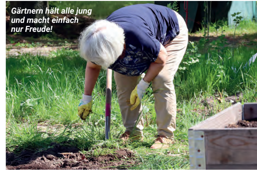
Gärtnern hält alle jung und macht einfach nur Freude!

Die Begeisterung der Menschen war kaum zu übersehen. Selbst die Sonne hatte es gut mit uns gemeint und kam nach einigen weniger sonnigen Tagen mit Kraft hervor. Der Grillstand sowie die Stände mit Kaffee, Kuchen und persischem Tee mit Gebäck im Garten Hegen wurden sehr gut besucht und führten zwischenzeitlich zu kleinen Menschenschlangen. Es war mit Freude zu sehen, mit wie viel Begeisterung die Kinder an den Ständen im Garten Hegen zu Stoßzeiten mithalfen.